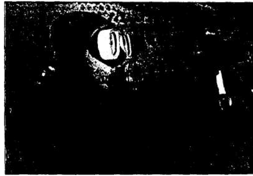
Carlos Correa, outro buzo, axusta con tino uns parafusos no buque.

Na Galiza son algo máis de cincuenta, se botamos do saco aos marisqueiros da navalla e do ourizo, que tamén viven de se ocultar ñas pozas e que comparten con eles riscos e inquezanzas.